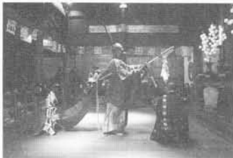
「延年の舞」演目:「祝詞(のつと)」 (2006.1.20. 毛越寺二十日夜祭 常行堂にて)