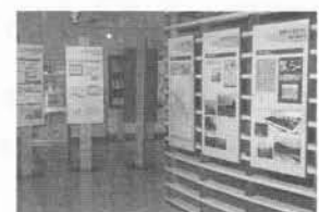
札幌市文化資料室の様子