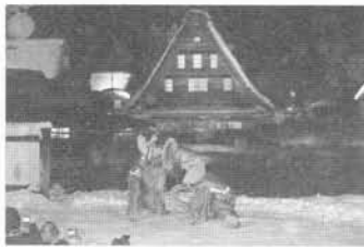
五箇山 菅沼合掌集落「こきりこ」

開催日 平成20年9月6日(土) 場 所 岐阜女子大学文化情報研究センター5・6F (岐阜市明徳町10番地 杉山ビル) 主 催 岐阜女子大学 文化創造学部 共 催 NPO法人 日本デジタル・アーキビスト資格認定機構