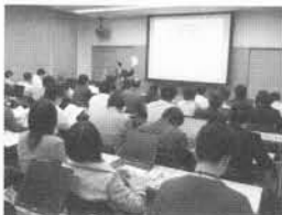
講義の様子 平成20年4月19日・20日 (新潟県立歴史博物館)

詳しくは、 http://dac.gijodai.ac.jp/manabi/ をご覧ください。